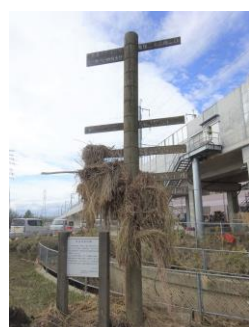
長野市赤沼 「善光寺平洪水水位標」