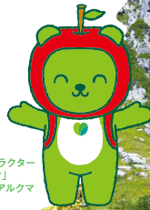
長野県 PRキャラクター 「アルクマ」 ©長野県アルクマ