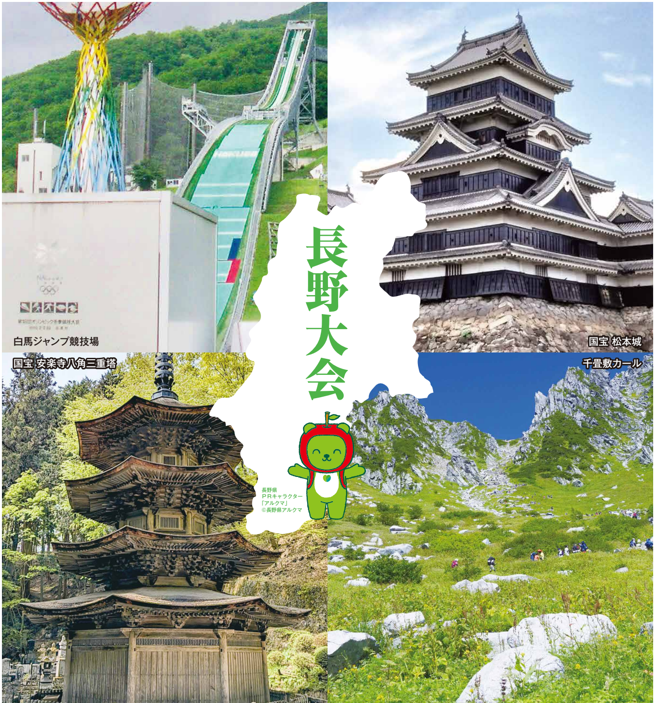
白馬ジャンプ競技場