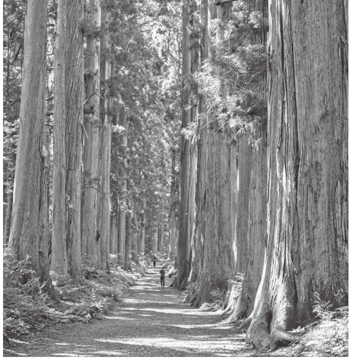
戸隠神社奥社杉並木