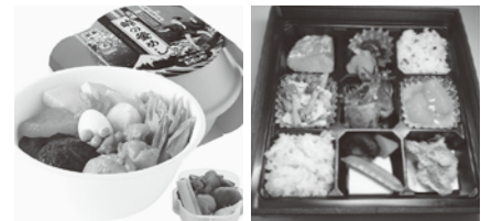
荻野屋 峠の釜めし 宝来 信州味覚弁当